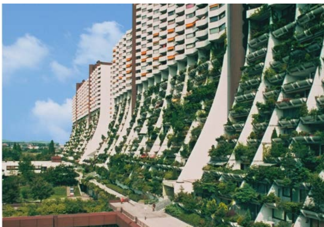
Wohnanlage Alt Erlaa, Wien. Architekt: Harry Glück